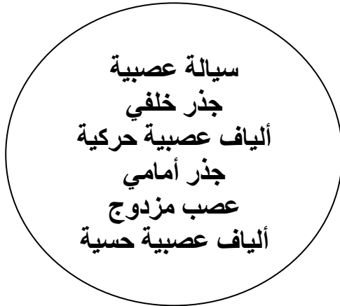
القائمة ( 2 )

أوصل بخط كل عنصر من القائمة ( 1 ) بالعنصر الذي يوافقه في القائمة ( 2 )