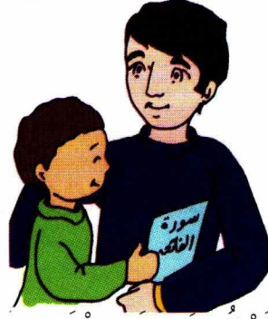
أَشْكُرُكَ يَا أَبِي الْكَرِيمِ