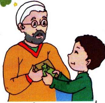
أُحِبُّكَ يَا جَدِّي الْعَزِيزِ