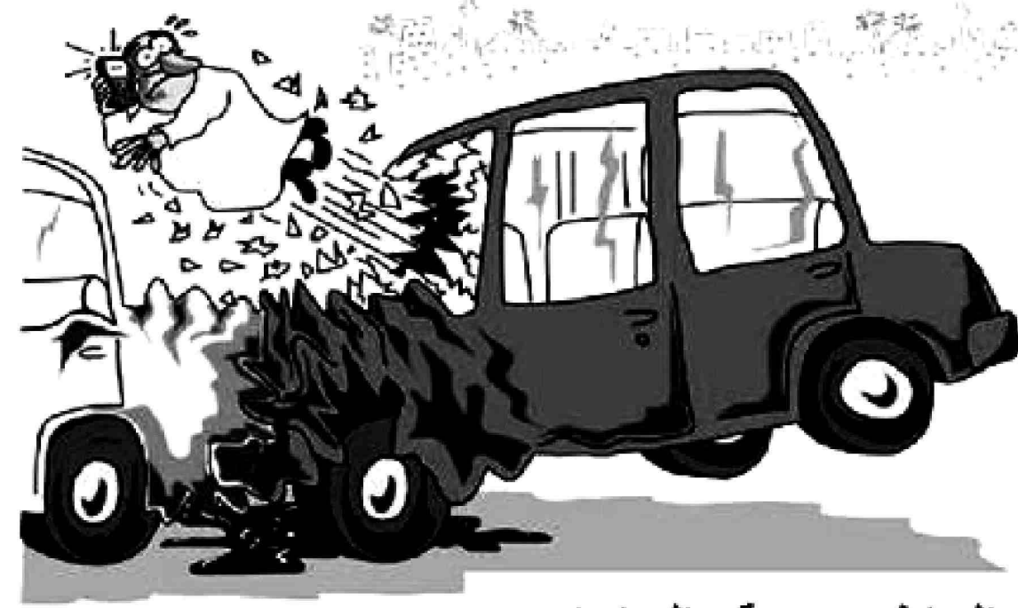
بسبب الهاتف ... وقع الحادث

⊙ التّعليمة: اكتبْ مَقالا - في صفحَة - لِتشارك به أصدقاءك على الفيس بوك ، تتحدّث فيه عن ظاهرة حوادث المُرور