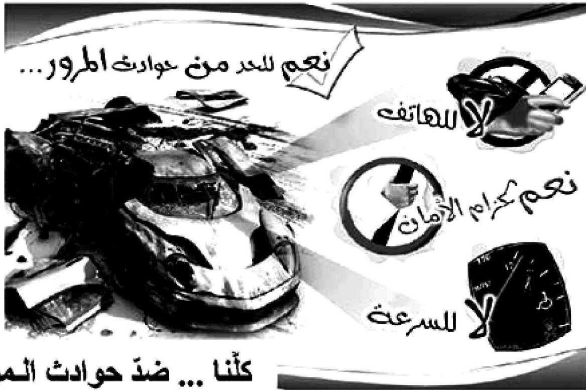
كلّنا ... ضدّ حوادث المرور