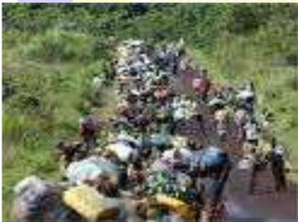
معاناة اللاجئين الأفارقة

من خلال مشاهدتك لشريط وثائقي حول إفريقيا اكتشفت أنما من أغنى القارات بالثروات الطبيعية المتنوعة إلا أنما تعاني من مشاكل حالت دون تحقيق التنمية الشاملة لشعوبها