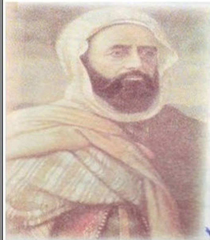
الأمير عبد القادر