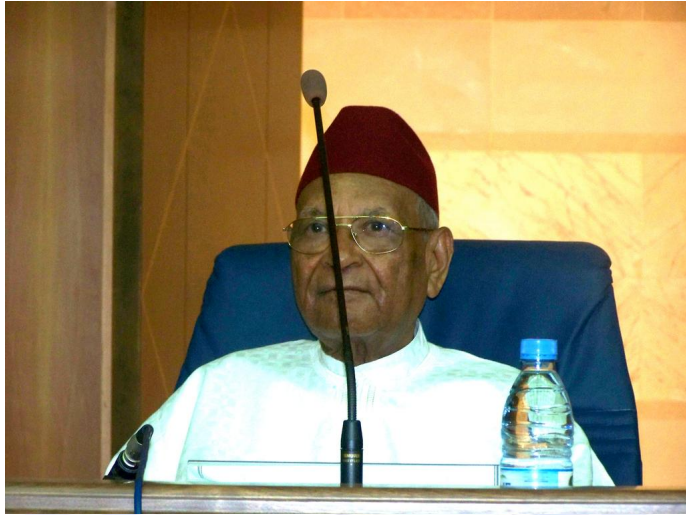
Amadou Mahtar M'BOW

Lis le texte suivant puis réponds aux questions :