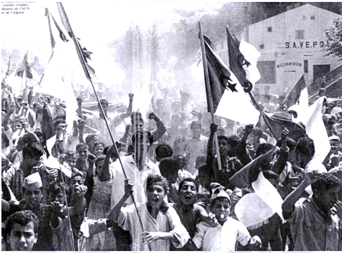
Manifestations populaires de l'indépendance